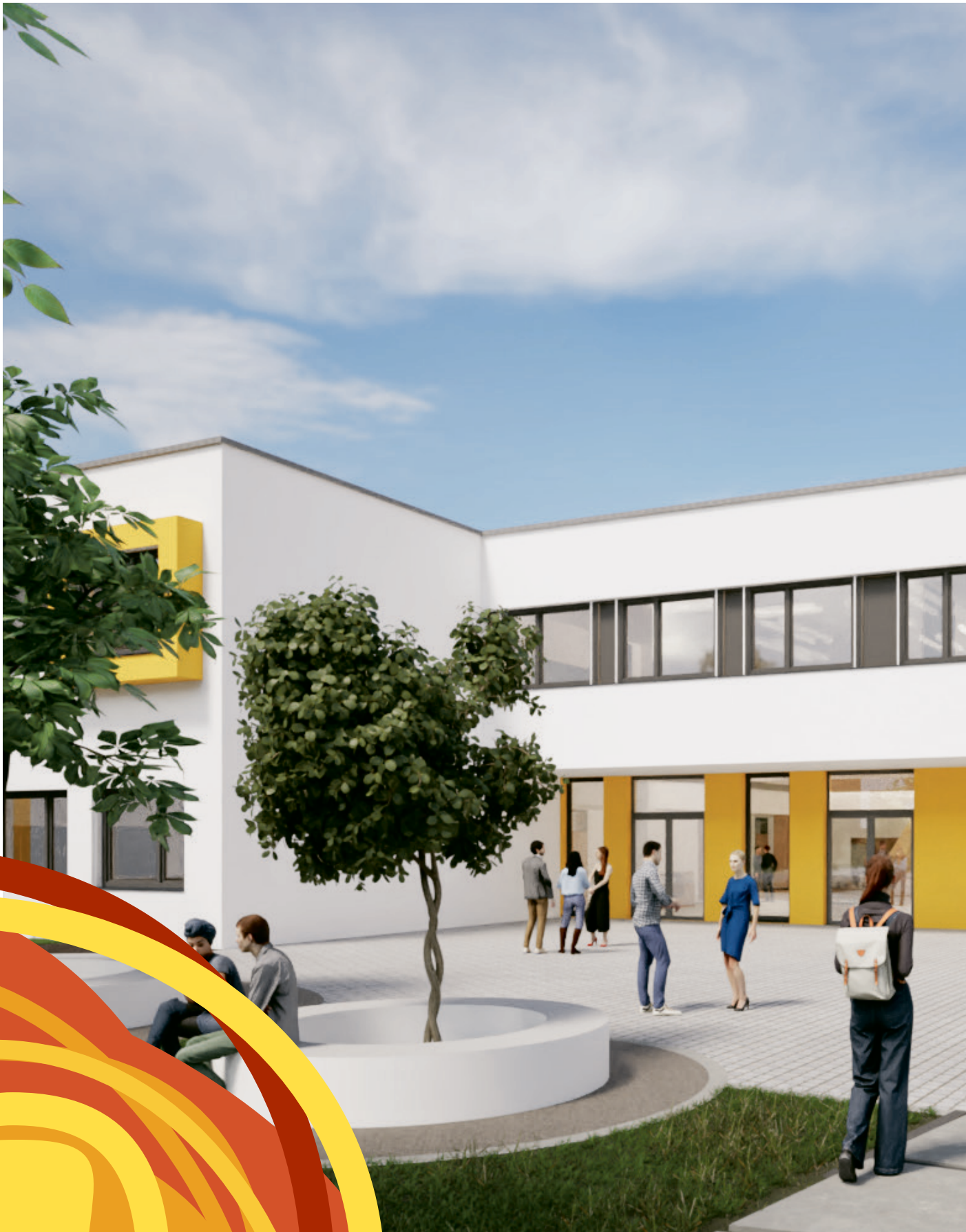
Haupteingang des Ceramico Campus